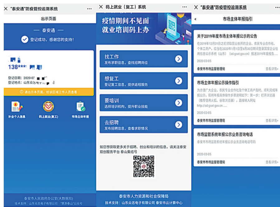
■“泰安通”防疫管控追溯系统

面对新冠肺炎疫情在全国蔓延的严峻形势,为进一步加强疫情溯源和监测,更好地维护广大人民群众的生命安全和身体健康,方便群众出行,按照山东省泰安市委、市政府领导要求,由泰安市人民政府办公室牵头,泰安市大数据局联合泰安市市场监督管理局、山东众志电子有限公司成立项目研发工作组,以疫情期间流动人员的轨迹追溯为手段,紧急开发“泰安通”疫情管控追溯软件。 疫情就是命令,防控就是责任,项目研发工作组依托泰安市大数据局系统设计规划经验,凭借泰安市大数据中心、云计算中心丰富的技术储备,经过项目工作组夜以继日的研发和测试,“泰安通”系统于2月14日10时正式面向全市上线运行,在商场、超市、居民社区、村庄、药店、医院、机关、企事业单位、酒店、宾馆、学校、汽车站等人员流动较大的公共场所全面推行“泰安通”扫码通行制度。